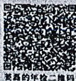
姜信的年检二维码

本证书经检验合格，继续有效一年。 This certificate is valid for another year after this renewal.